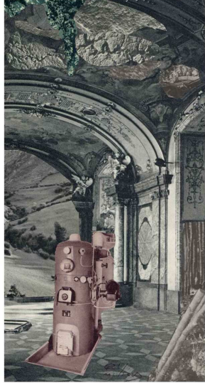
Dean Claydon (Rochford, Inglaterra, 1971) Baño , 2010. Lápiz sobre papel. 31 x 44 cm.