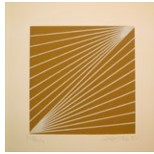
Sin título , 1973. Serigrafía. 15 x 15 cm. Ejemplar 238/350